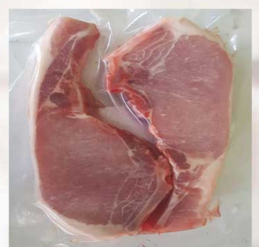
Premium Pork Chop