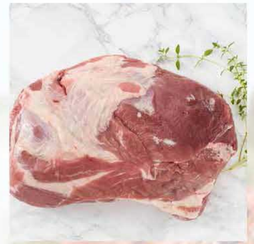
Shoulder Meat / Jasio