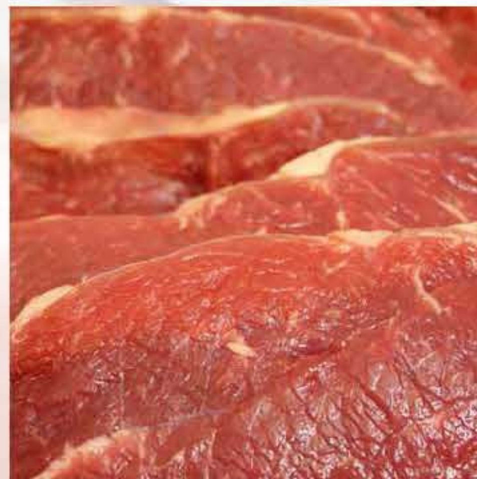
Baikut Tulang Muda