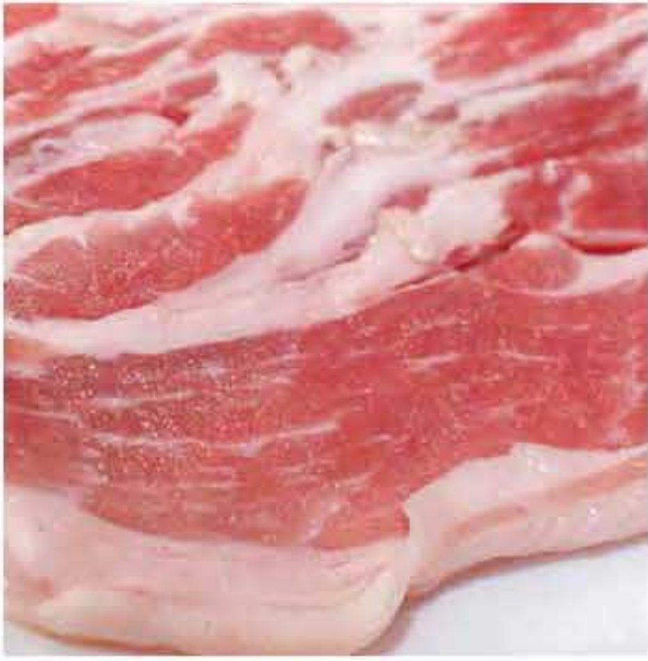
Sam Gyeop Sal