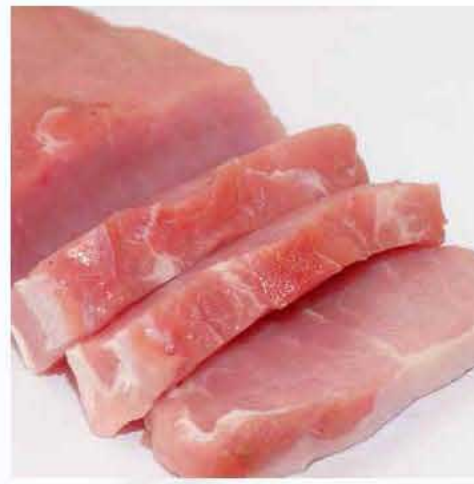
Pork Loin / Lulur Luar