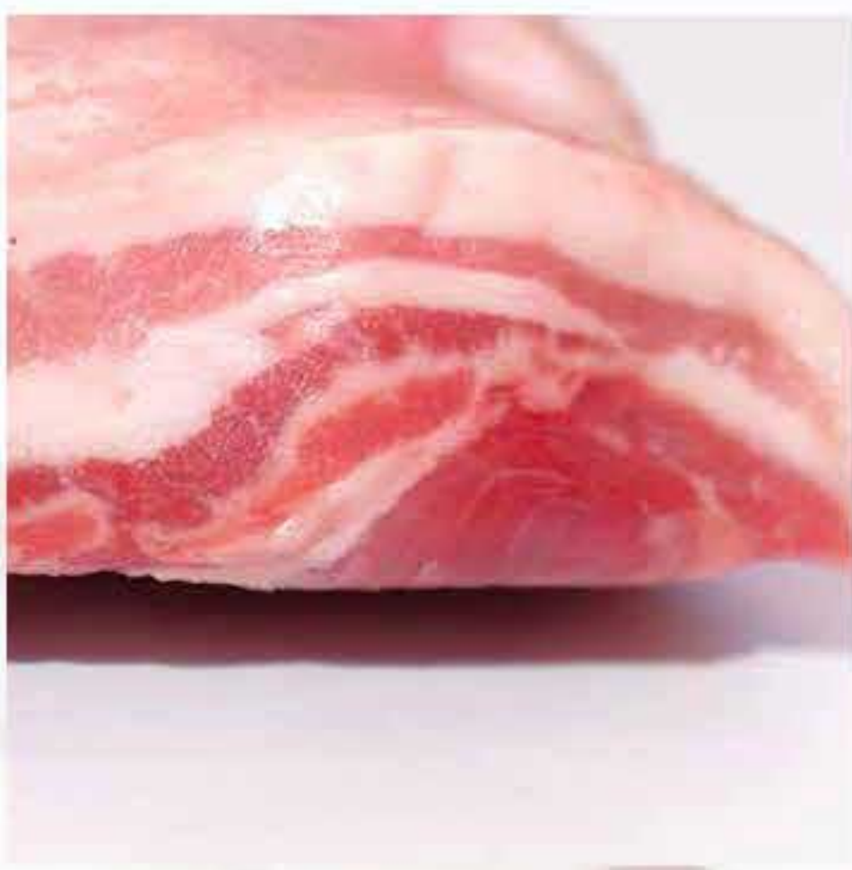
Sancam / Pork Belly Skin On