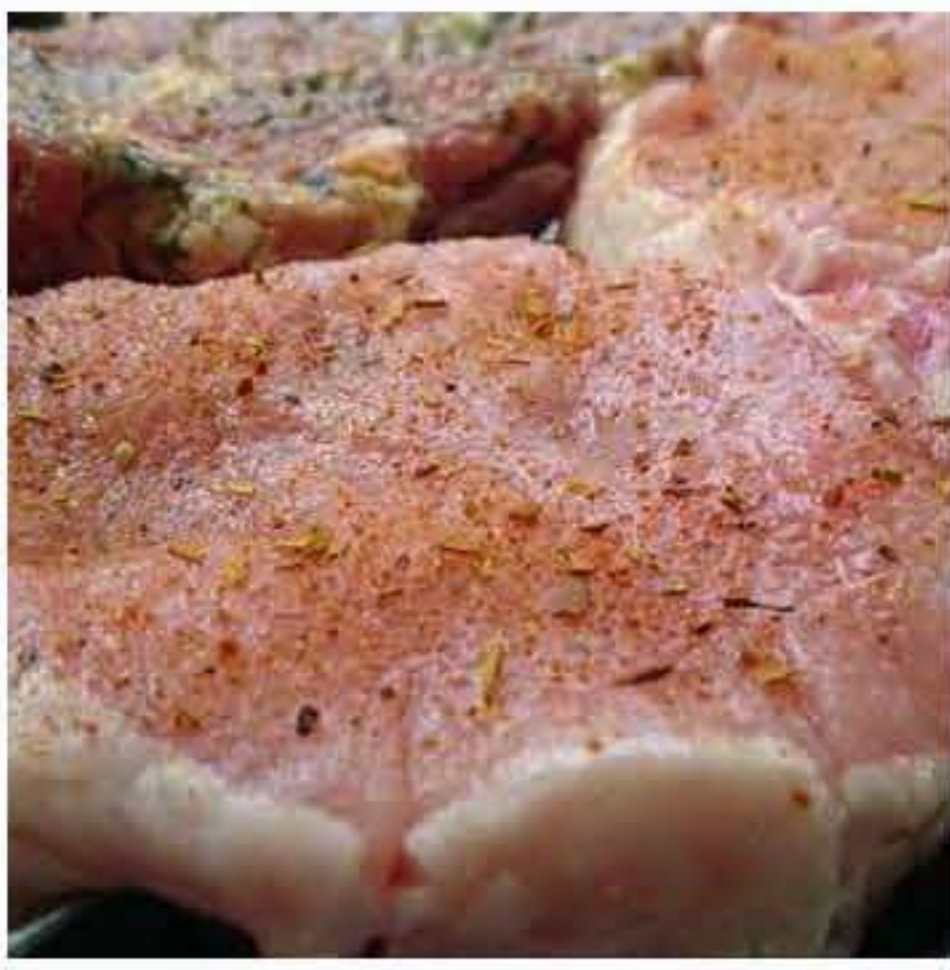
Daging / Ham