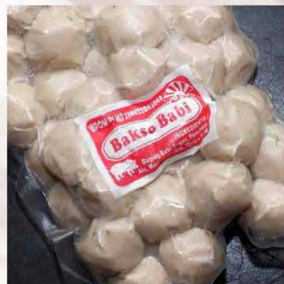
Baso Babi / Pork Meat Balls