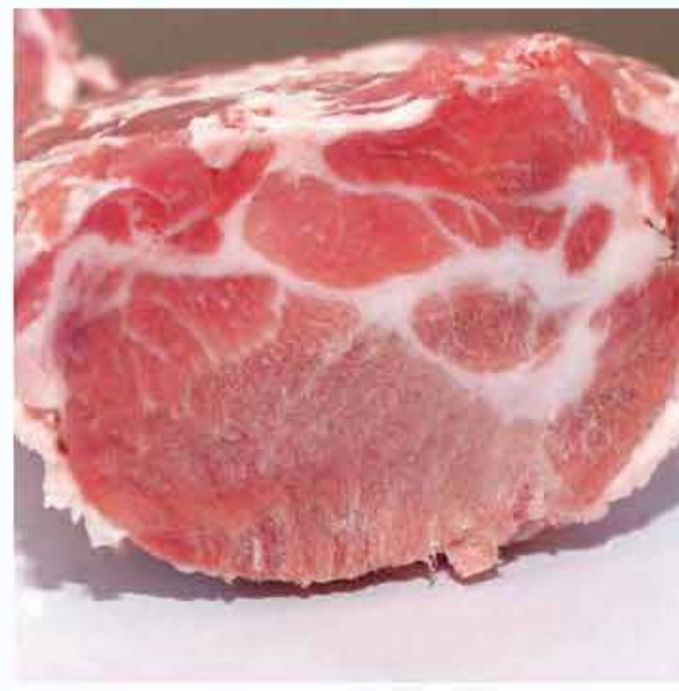
Satean / Boston Butt