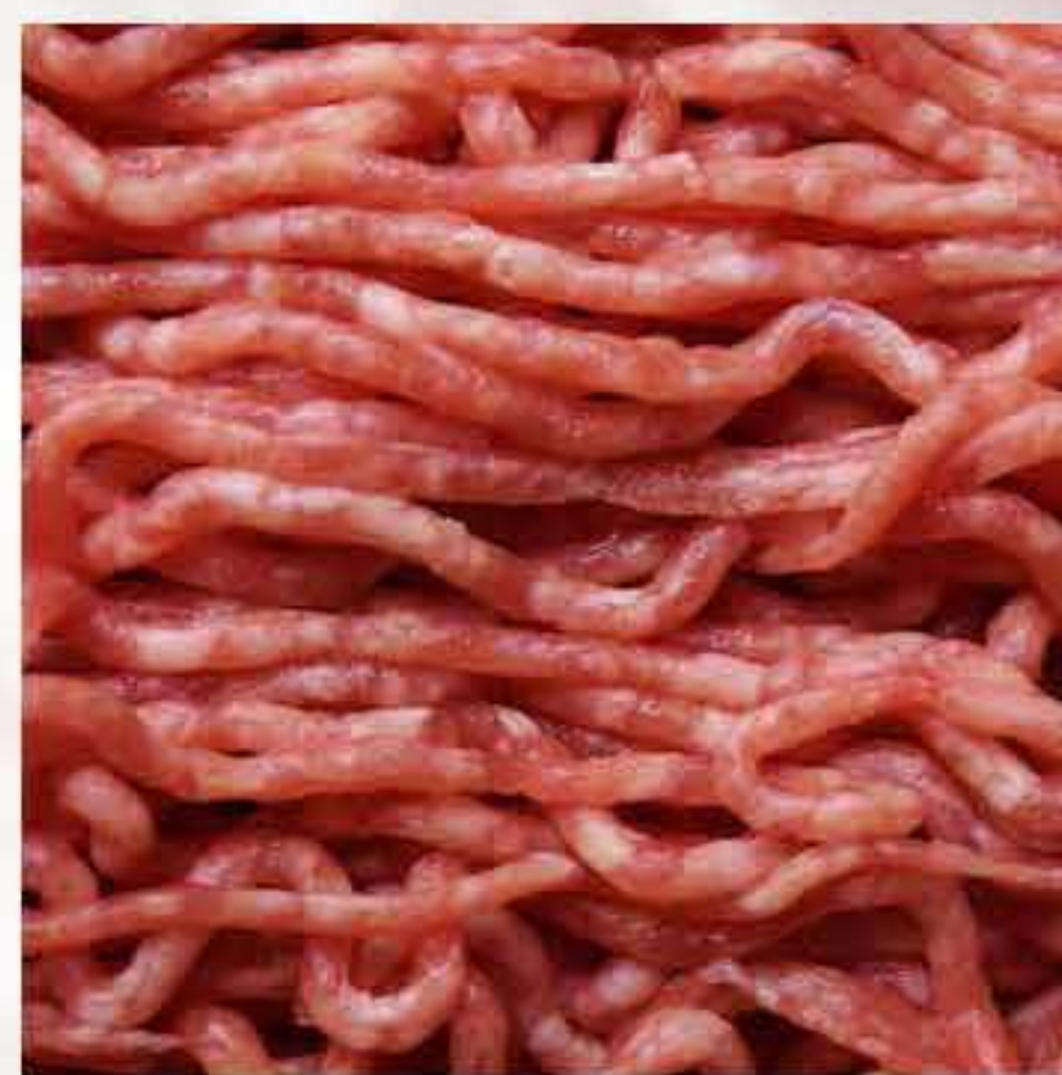
Daging Cincang Minced Pork