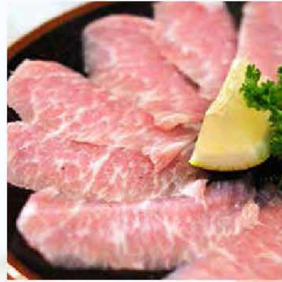
Ham Gyeong Sal / Korean Pork Cheeks