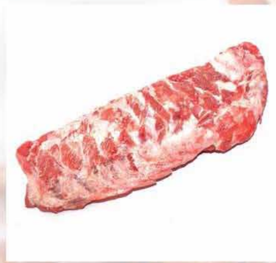
Iga / Baikut (Spare Ribs)