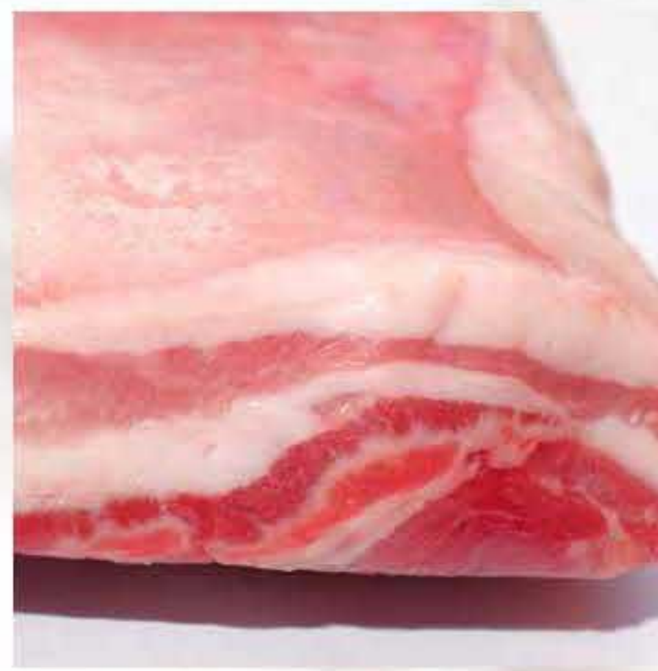
Sancam / Pork Belly Skin Off