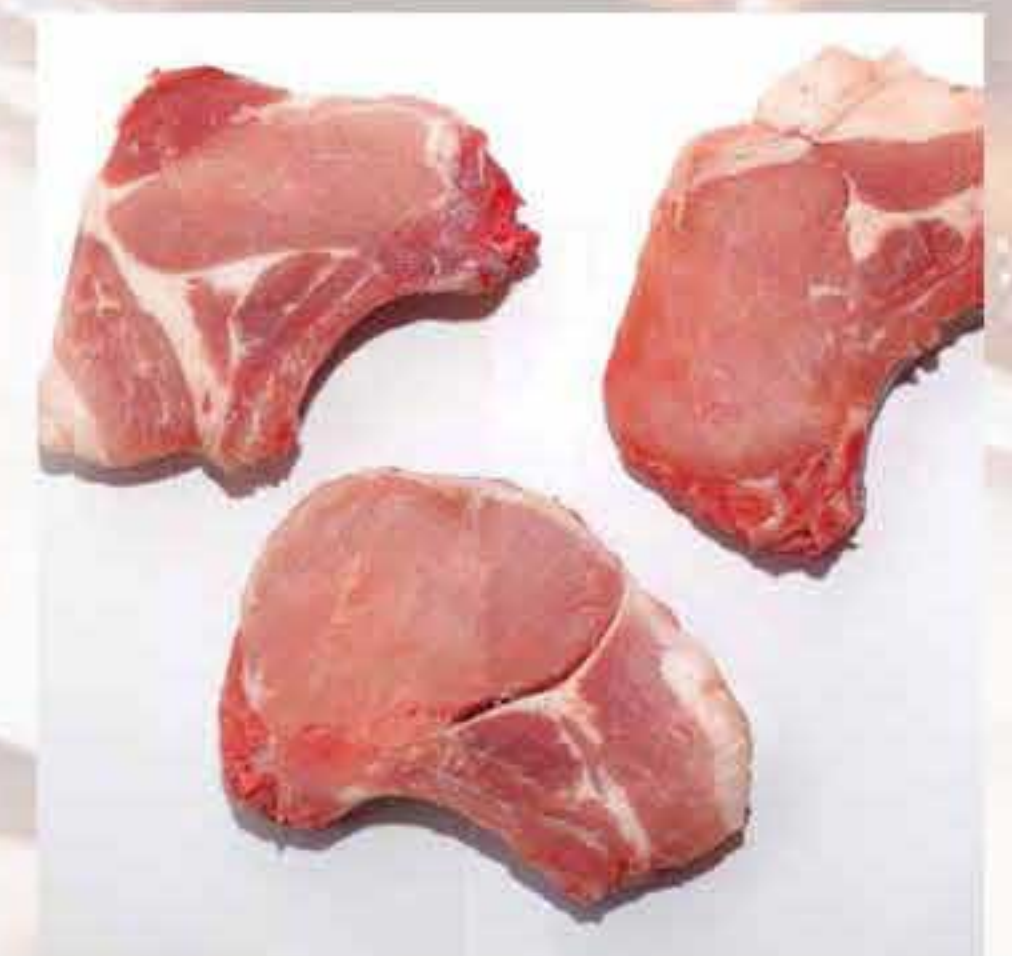
Pork Chop (Manual Cut)